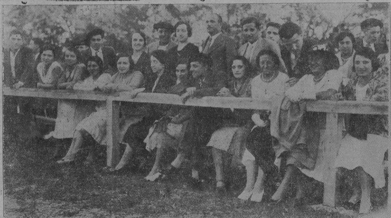
Un aspecto del pase de preferencia durante el partido celebrado anteayer entre el Unión Club, de Irún y Osasuna y es el que triunfó brillantemente el equipo pamplonés