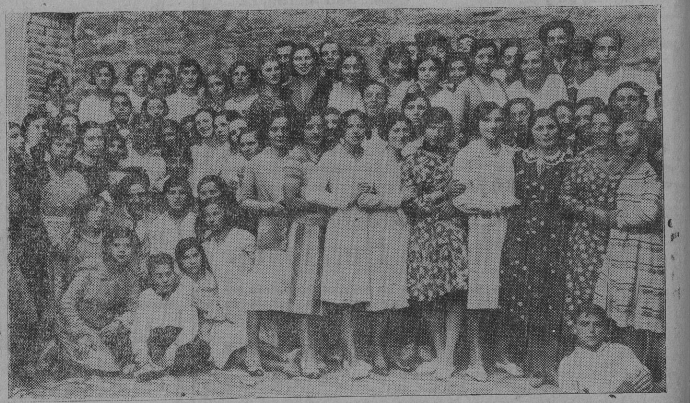
Un grupo de jóvenes, durante un descanso en el concierto celebrado el domingo por la mañana