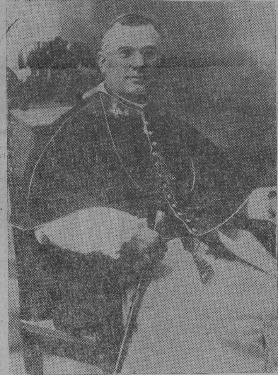
Monsiñor Sabas Sarasola, Obispo de Ténaro y Vicario Apostólico del Uruhamba y Madre de Dios, del Perú que el domingo celebró sus Bodas de Plata sacerdotales