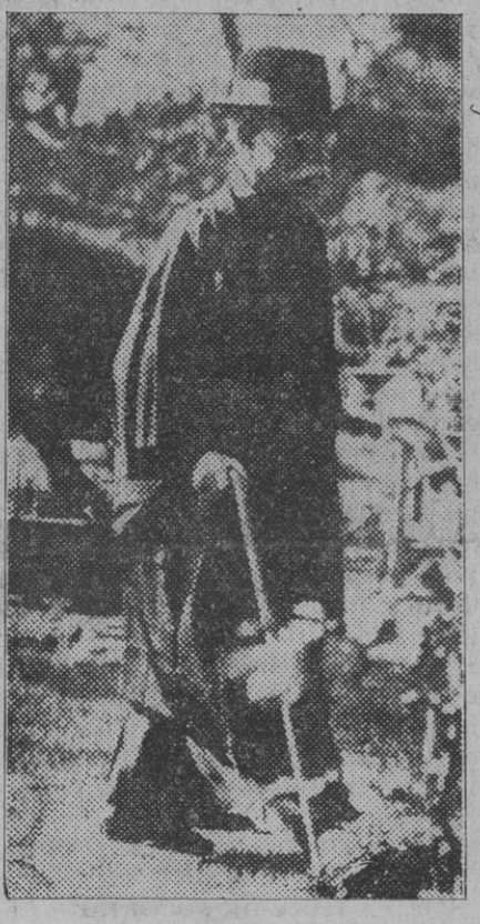
El presidente del Gobierno japonés, Hamaguchi, que ha muerto a consecuencia de las heridas que le infirió hace tiempo un anarquista