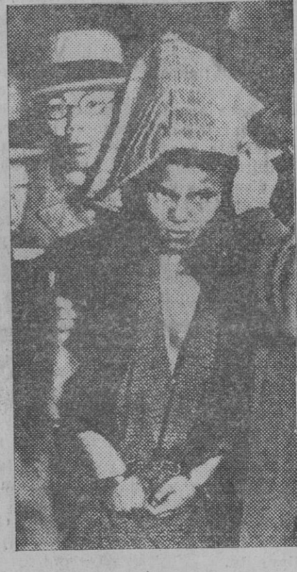
El anarquista Sagoya que, hace meses atentó contra la vida del Presidente del Gobierno japonés quien ha muerto recientemente

guía su yunta de bueyes y en la guerra aparece heroico con su arma, su capote y su casco, en la trinchera. Hubo un Ayuntamiento reformador que intentó bujarrear la magnífica fachada de la Casa Consistorial. No terminó ese Ayuntamiento su atentado porque al ejecutar el desaguisado se encontraron con que para bujarrear esas fachadas, tenían que destruir la talla de las piedras, deformar su factura y dejarla del todo imposible. Nuevamente se ideó el traslado de esa fachada, la desaparición total de la Casa Consistorial, que tan oportunamente encuadra, ilustrándola, la Piazzuela Consistorial. Ahora ha desaparecido el monumental fachada del Teatro Gayarre y han quedado allí dos caserones que hacen el efecto de una boca mellada y desdentada. Claro que la fachada están colocandola en el nuevo Teatro de la Avenida de Carlos el Noble pero... ya esa fachada clásica no elegantiza nuestra hermosa Plaza. Y contra ese afán insano de innovación y destrucción protestamos. Le toca ahora el turno al Portal de Francia y una vez que lo destruyan nos obsequiarán colocando esos venerables vestigios en algún parque público en que vean los extranjeros nuestra cultura a contrapelo y leerán asombrados aquello de Reinando don Filano siendo Virrey de Navarra el duque de Alburquerque... Y nos mandarán a paseo con el Parque. HILARIO OLAZARAN