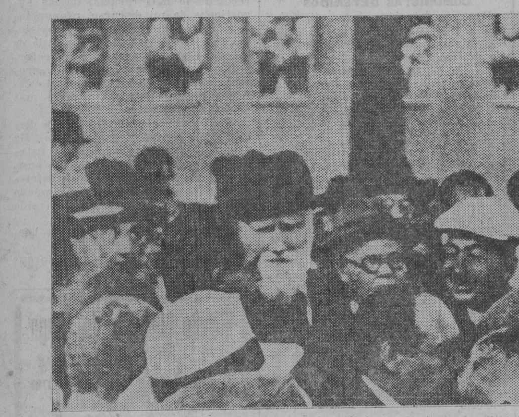
BERNARD SHAW EN RUSIA.—Durante su reciente viaje a la República de los Soviets, Bernard Shaw ha sido festejado por las autoridades y el pueblo ruso. He ahí el momento de su llegada a Moscú, rodeado de intelectuales y proletarios.

Las fuerzas perdidas durante su enfermedad gripal puede devolvérselas rápidamente el GRAN VINO "ANIBAL" Así lo recomiendan eminentes doctores de todo el mundo