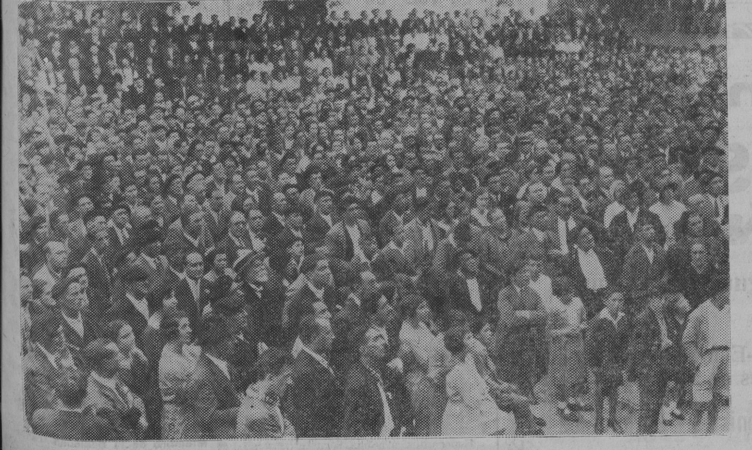
DE ELIZONDO.—Aspecto parcial del frontón durante la celebración del miting de afirmación vasquista (Foto Zaragüeta).

El emplazamiento.—En el lugar de visita que realizarán los jugadores del París Université Club, que jugarán el próximo septiembre en Madrid, además de la excursión de los madrileños a tierras africanas, se va a hacer un programa rugbístico de verdadera monta.