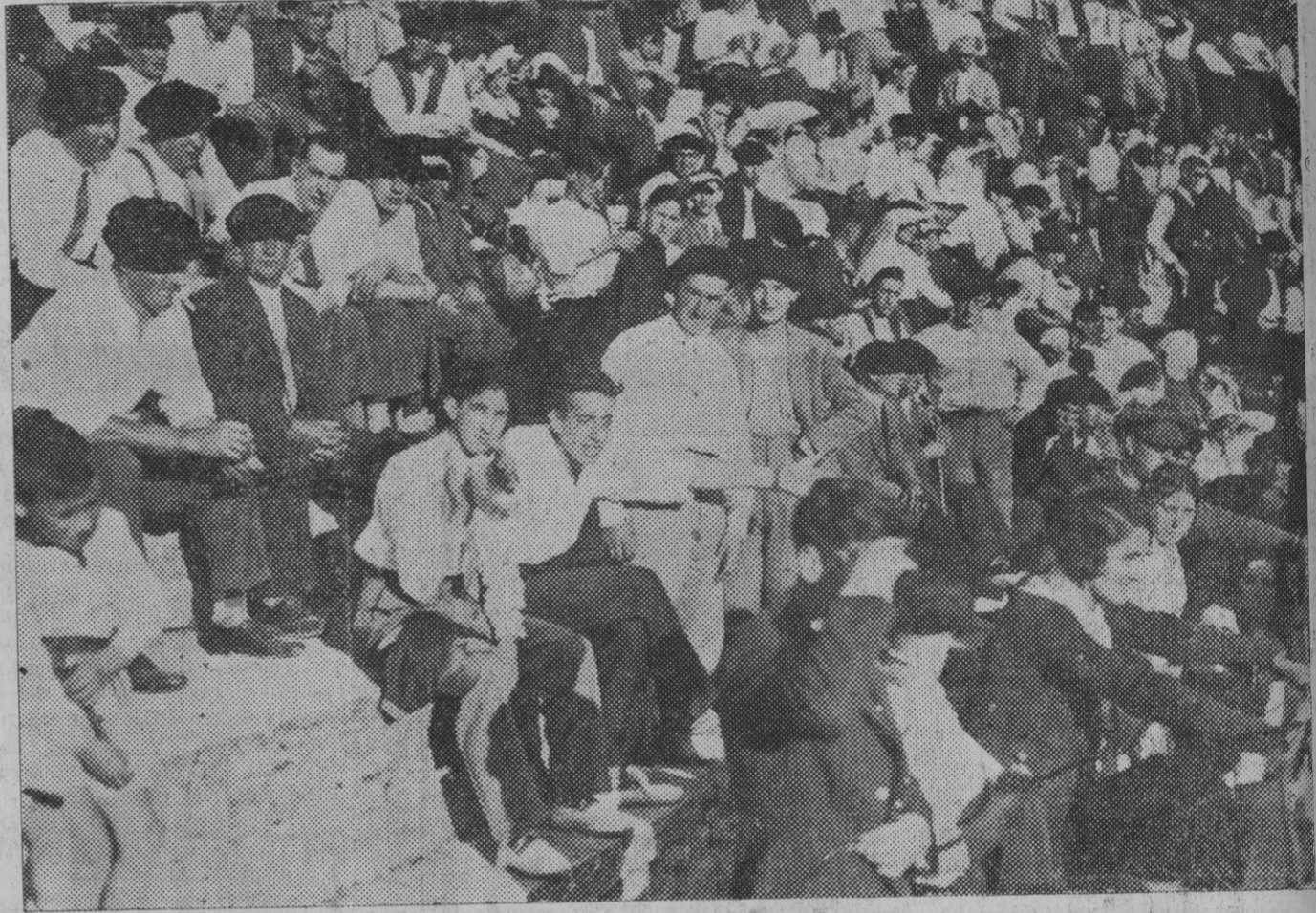
Aspecto de la plaza de Tafalla en el tendido de la "gente de bronce". Caras tristes, mucha boina... y pocas mijeres. ¿Por eso es más barato?