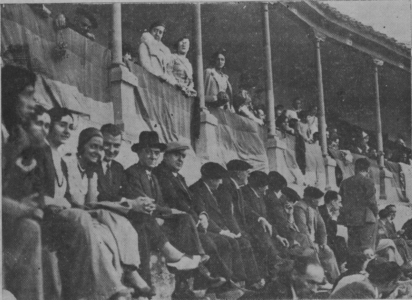
Chicas guapas y señores comedones presenciando la novillada sin "aprietos"; más que público de toros parecen gente de concierto.

Los encargos en la Pumerari de Ciba Zapatería, 56 P. M. PLAZA Tel. 2715