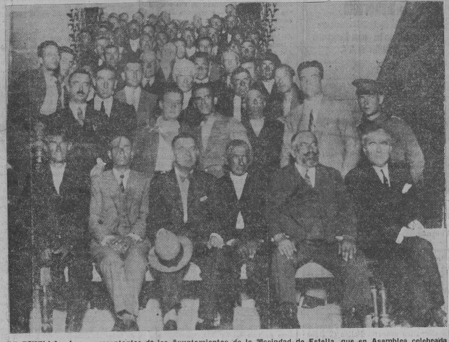
DE ESTELLA.—Los representantes de los Ayuntamientos de la Merindad de Estella, que en Asamblea celebrada anteaer en la cabeza de la Merindad, acordaron adherirse al Estatuto Vasco.

Estatuto se recaban, pues las demás han de continuar a cargo del Estado Central como a su cargo continuarán los respectivos servicios, aunque nos acepte el Estatuto. Y para esa deducción hay margen sobradísimo en el cupo. Para esa deducción y... para que yo no anónimo y ameno comunicante y yo nos compremos en Casa de Mina sendos jamones de Westfalia. Y basta por hoy. Mañana hablaremos del costo del Clero en relación con el Estatuto y de los demás millones, además de los equivalentes a los seis del cupo, que el Estado se gasta en Navarra. Todos los cuales millones, como verá el lector, se los pagamos o pagaríamos también, y con largueza, los navarros al Estado Central antes del Estatuto y después del Estatuto. Jesús Etxayo.