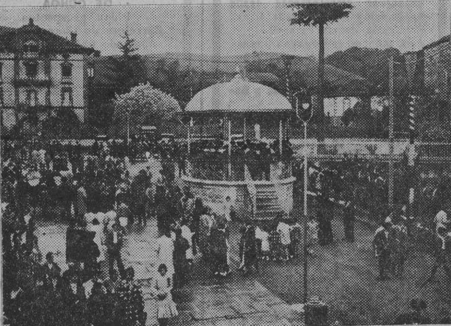
La Banda de Música de Pamplona durante uno de los conciertos ejecutados en la linda villa baztanosa