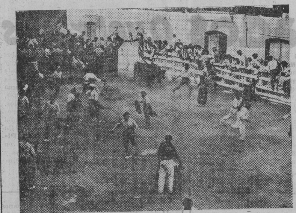
Uno de los encierros celebrados el domingo.