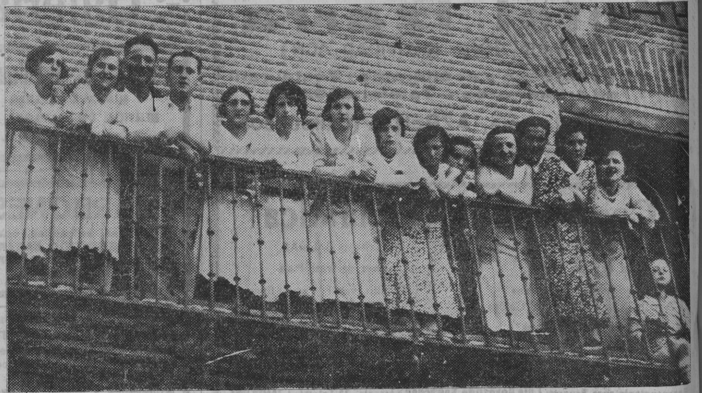
Grupo de bellas muchachas contemplando las vaquillas desde un balcón de la plaza.