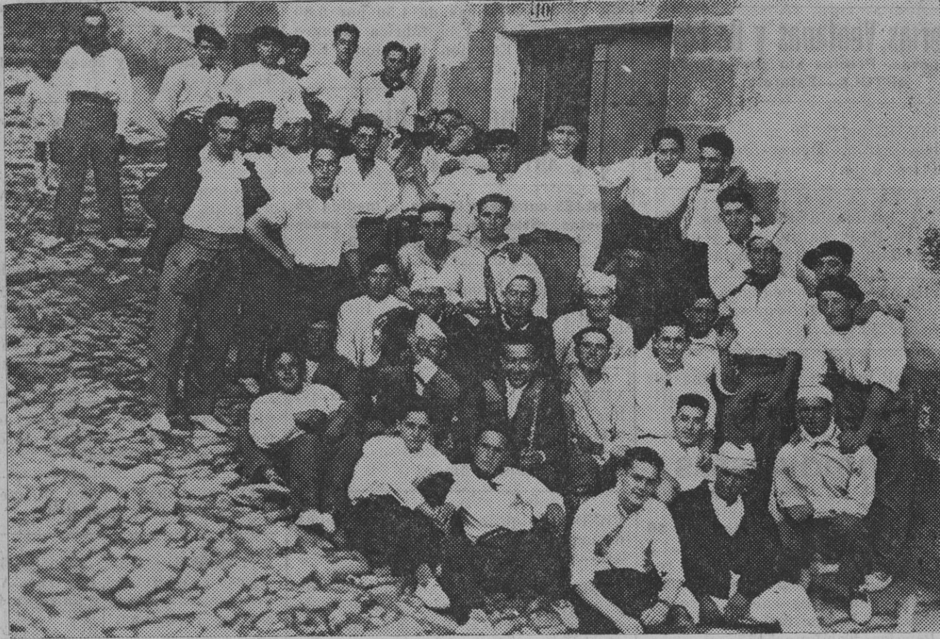
Una de las cuadrillas de jóvenes que más se han divertido durante las fiestas celebradas en honor de Santiago Apostol