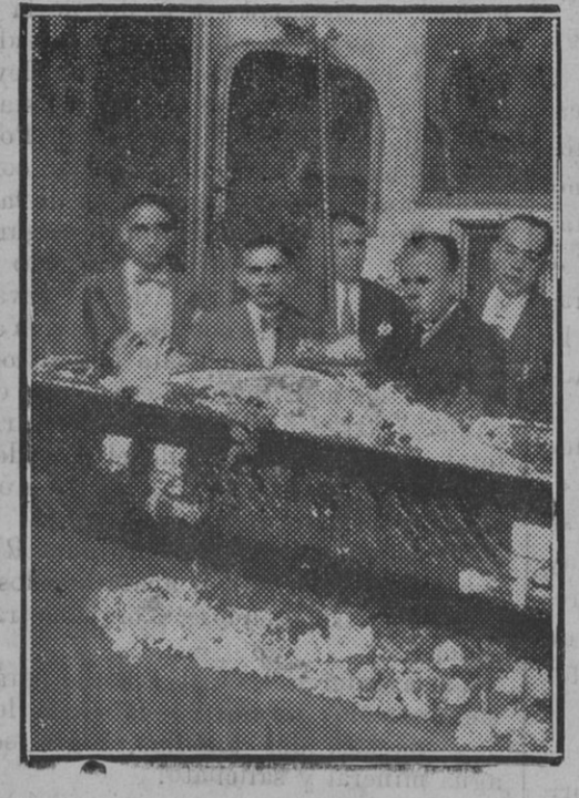
El insigne Romero de Torres en la caja mortuoria, velado por sus amigos y personalidades cordobesas

Muchos vecinos de la plaza del Potro, donde está la casa del finado han envia-