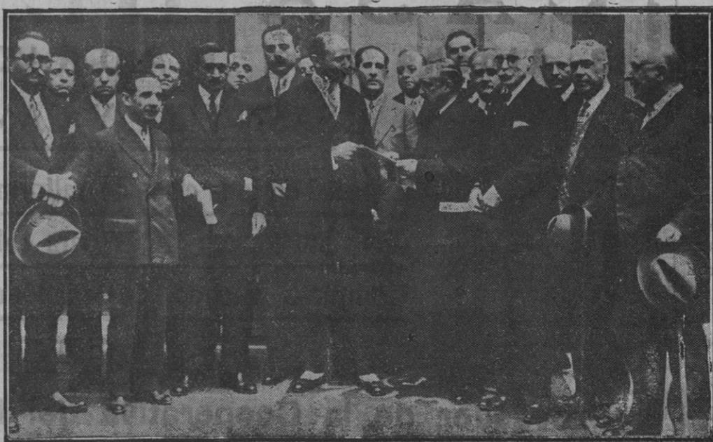
El alcalde recibiendo del presidente del Centro de Hijos de Madrid la instancia

Ayer a las doce, se celebró el acto de hacer entrega oficial al alcalde presidente del Ayuntamiento de esta villa y corte, de la instancia en la que, suscrita por el presidente del Centro de Hijos de Madrid, en nombre de esta entidad, y con la adhesión de la Asociación de Escritores y Artistas, Sociedad de Autores, Sindicato y Montepío de Actores, Círculo de Bellas Artes, de Actores, La Capa, Asociación de la Prensa, Casino de Madrid, Empresas de los teatros de la Comedia y Lara, ac-