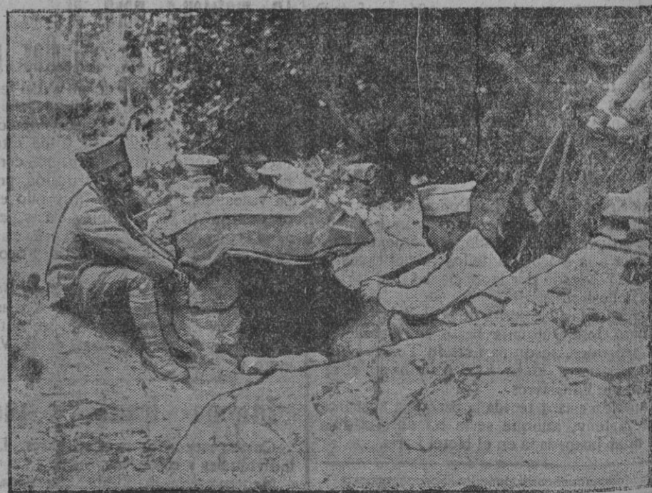
Soldados en la entrada de un abrigo.