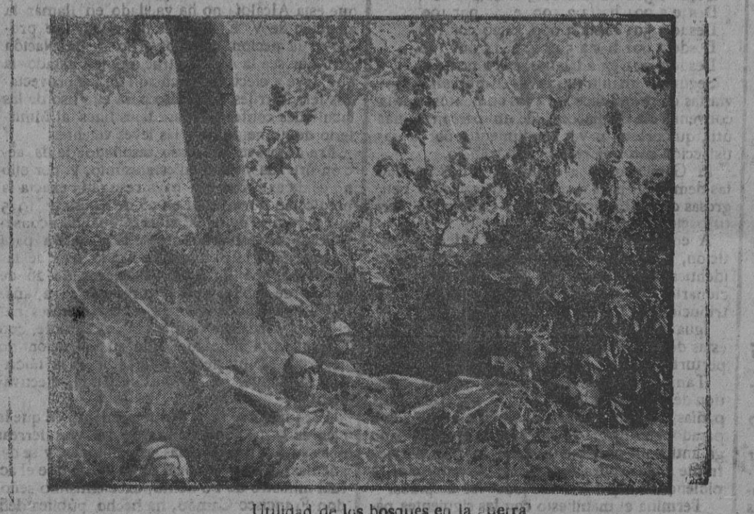
Utilidad de los bosques en la guerra

Hay buena impresión respecto al espíritu conciliador, que, según parece, muestra el Gobierno alemán sobre la nota española.