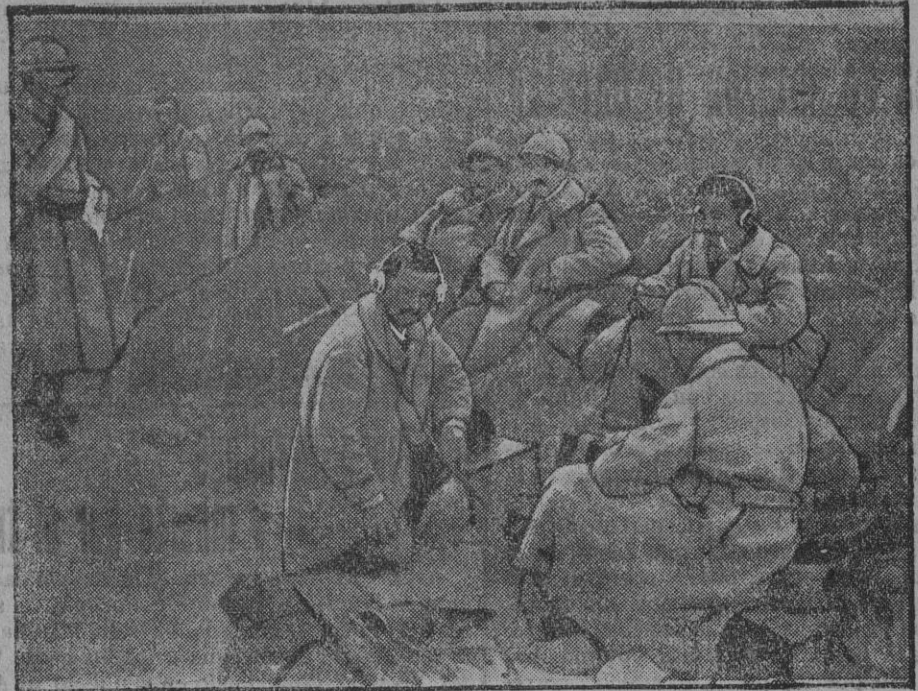
Puesto de mando francés durante un combate.

TOLEDO 26.—En Camuñas se desencadenó una violenta tempestad.