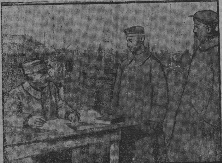
Interrogatorio de prisioneros.

ESTOCOLMO 24.—Según un telegrama de Helsingfors, el movimiento revolucionario se extiende rápidamente en Karelia. Es imposible decir si el movimiento es espontáneo o fomentado por los alemanes.