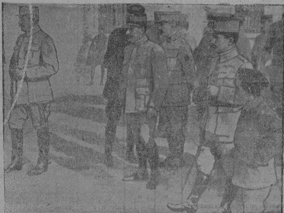
El general Maistre presenciando el desfile de los prisioneros hechos en el monte Tomba

Cuanto se relaciona con la colaboración política, militar y literaria de EJERCITO Y ARMADA, es de la exclusiva competencia del director.