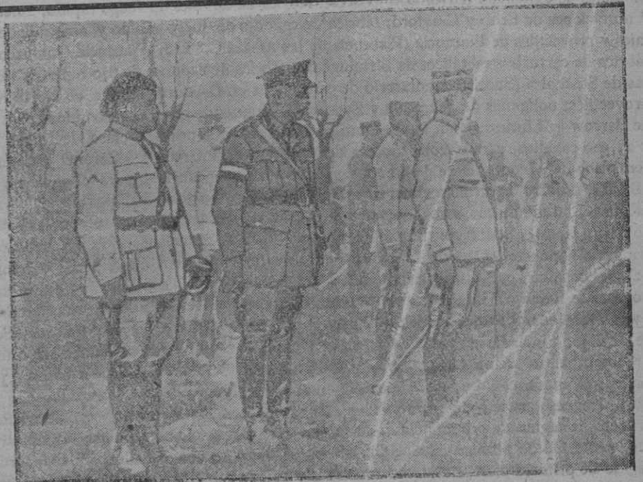
El general Fayolle revista las tropas que han tomado el monte Tomba.

Estos barcos, de los que hace tiempo no se tienen noticias, son el «Purritella», de 5.528 toneladas; el «Jumau», de 4.152; el «Nords-erth», de 3.509; «Bee», de 1.169; «Wiruna», de 3.947; «Winslow», de 567; «Belunga», de 568; «Anoore», de 651; «Natalaga», de 1.666;