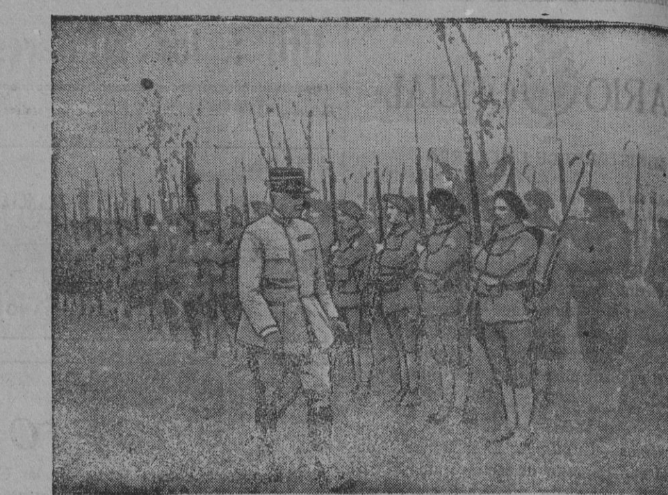
El general Fayolle revistando un batallón de Cazadores.

Las antedichas subastas se verificarán con arreglo a lo dispuesto en el vigente Reglamento