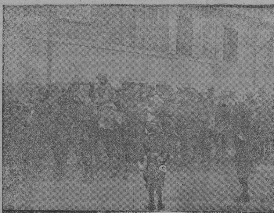
Desfile de Caballería francesa.