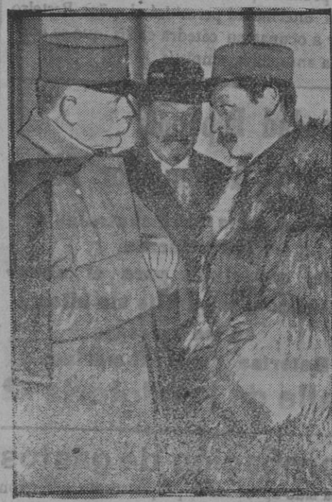
Llegada a París del general Sarrail.

Los que cesaran en las Academias por otras causas distintas de las indicadas, serán obligados a prestar el servicio que determinó la exclusión temporal, entrando para ello en el turno forzoso de destino a partir del mes siguiente de su cese.