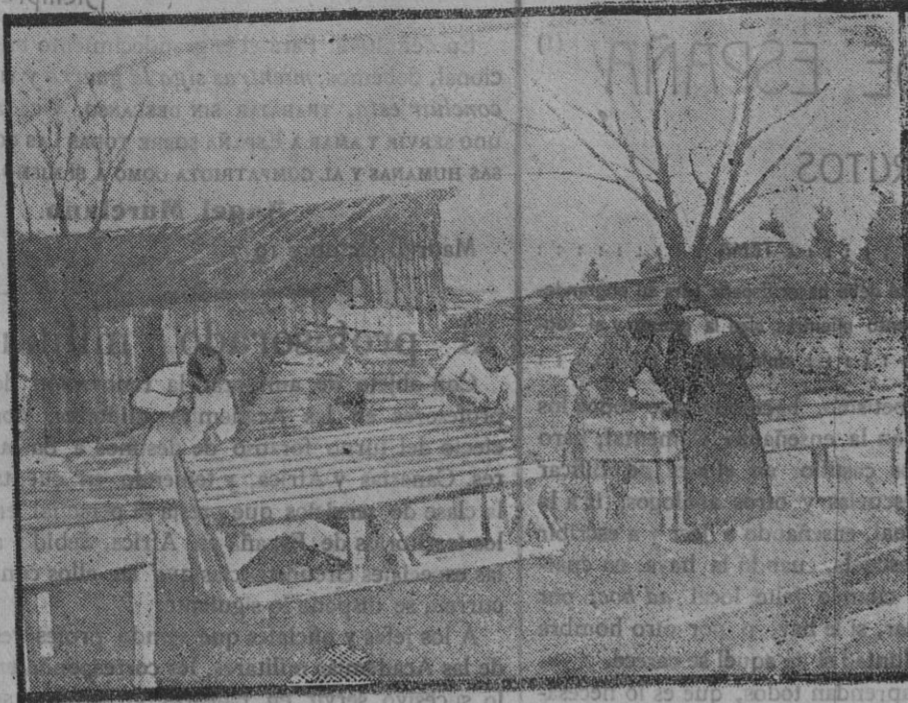
Mujeres trabajando en las serrerías militares.

Al propio tiempo queda modificado en el expresado sentido, cuanto se oponga a esta disposición, y en particular la Real orden de 9 de Octubre de 1901.