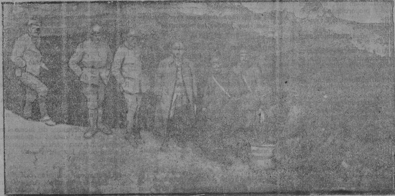
Entrada de las cavernas del Aisne.