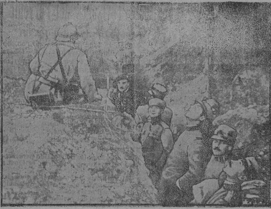
Oficiales franceses e italianos inspeccionando el sector italiano.

invasión. Lo que ocurre ahora en las negociaciones germanorusas revela lo que acontecerá en el frente occidental, caso de incurrir la Entente en el mismo error; es decir, si los aliados entablasen conversaciones con Alemania, sin valerse de garantías y seguridades».