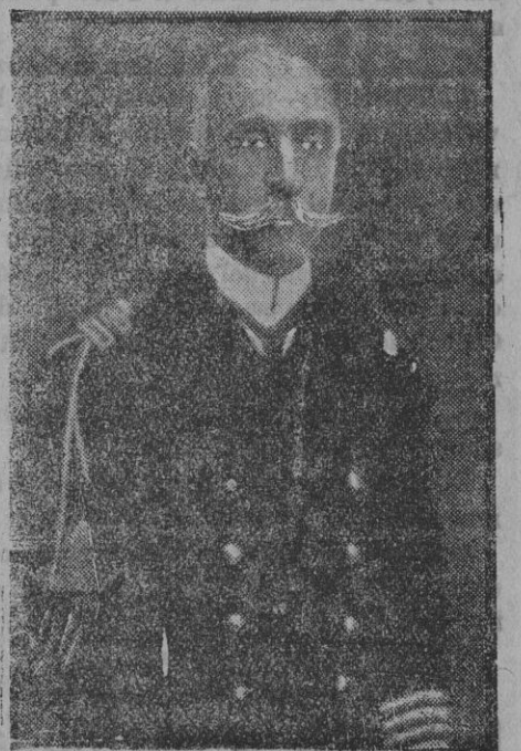
El almirante griego Coundouriotis.

«Los sueldos de que... «disfrutan» los empleados de la clase media eran ya insuficientes para vivir. Con la carestía ambiente y elevación del precio de los artículos, esos sueldos, prácticamente, han disminuido, haciendo la vida imposible. Urge, por consiguientes, aumentarlos.»