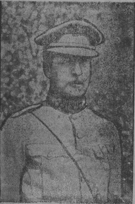
El rey de Bélgica.

El «Herald» dice poder asegurar que el Kaiser ha hecho saber a todas las unidades del frente occidental que concederá una condecoración, un premio de 300 marcos y un permiso de tres semanas al primer soldado alemán que haga prisionero a un soldado americano.