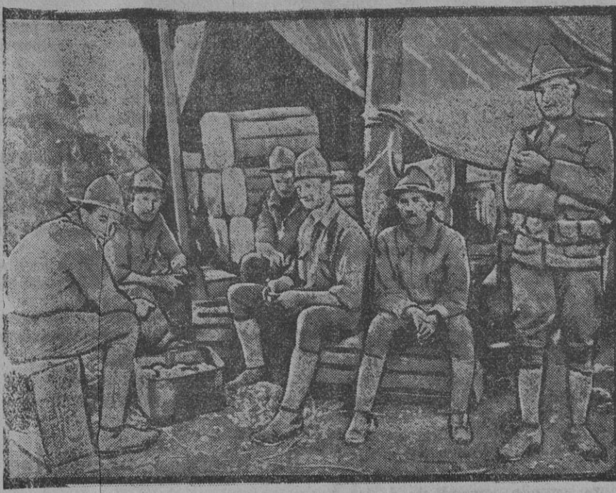
Soldados americanos en un campamento francés.