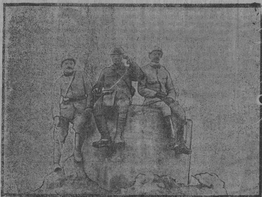
Telefonistas ingleses instalados en un antiguo abrigo alemán.