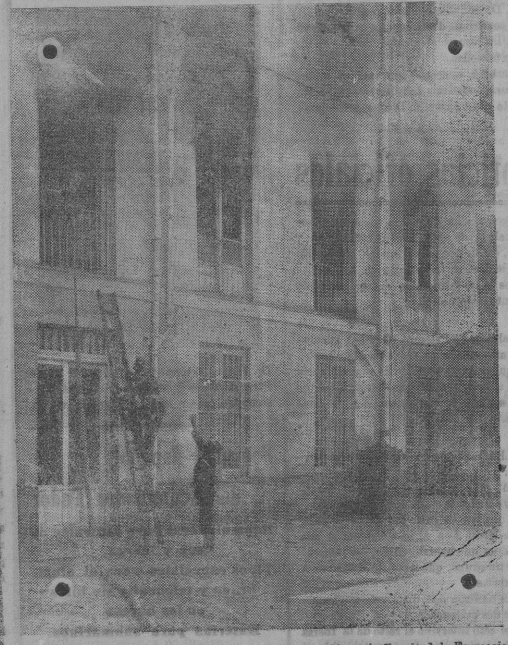
Los bomberos durante la extinción del incendio ocurrido en la Facultad de Farmacia.