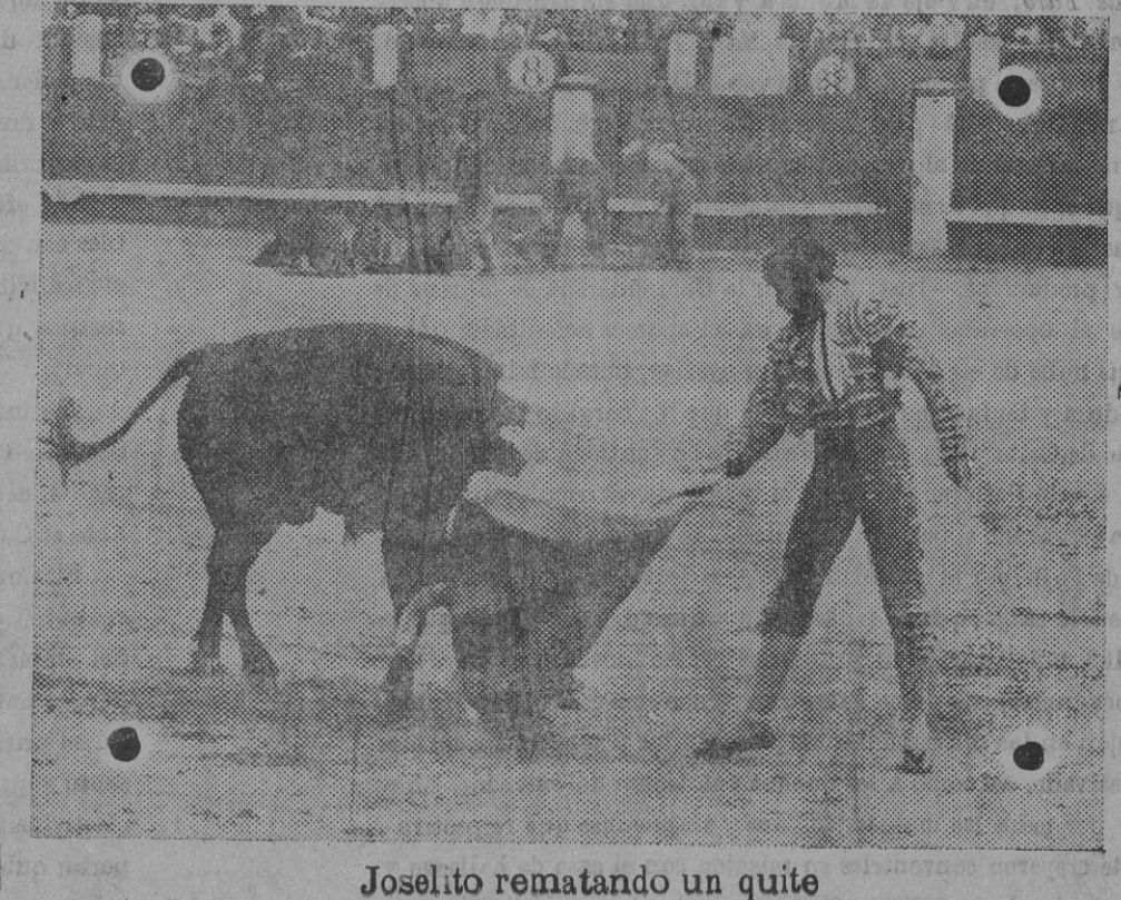
Joselito rematando un quite