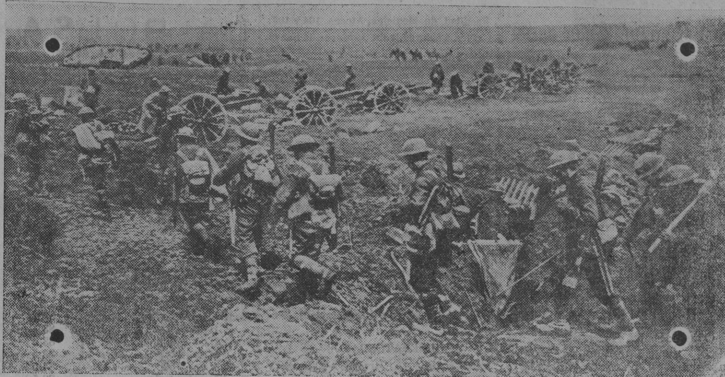
Una de las escenas en el gran avance británico del mes de Abril, en el norte de Francia. La infantería en marcha hacia la línea de fuego, protegida por la artillería.