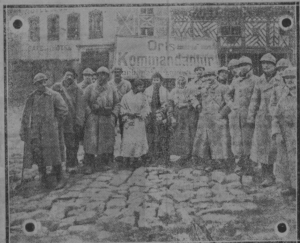
Entrada de los franceses en Roye.—Grupo de soldados y habitantes del pueblo delante del cartel arrancado de la fachada de las oficinas militares de los alemanes.