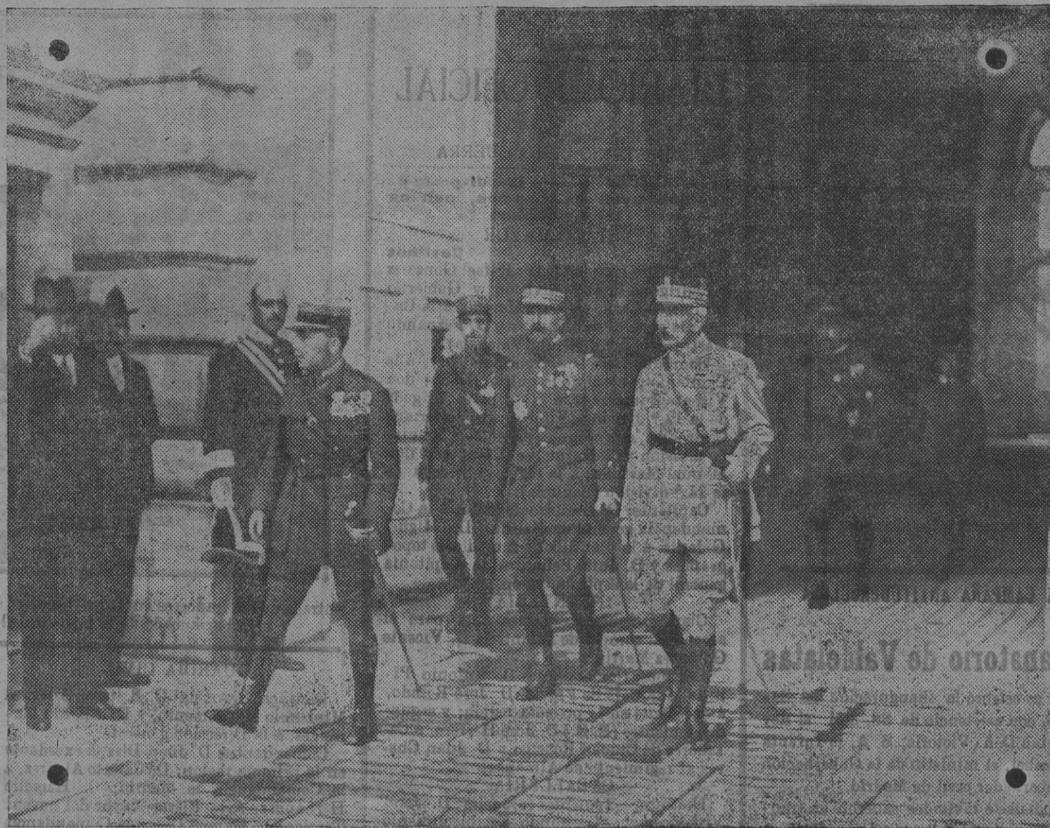
Los generales Laroses, Lyautey y Gouraud, al salir de Palacio de es uadar s S. M. el R. y. (Fot. Alfaro).

ROMEA (calle de Carretas).—Cinema y variedades. Secciones a las seis y media, diez y once y media. Excelentes cuadros artísticos, formados por las más renombradas estrellas del arte escénico.