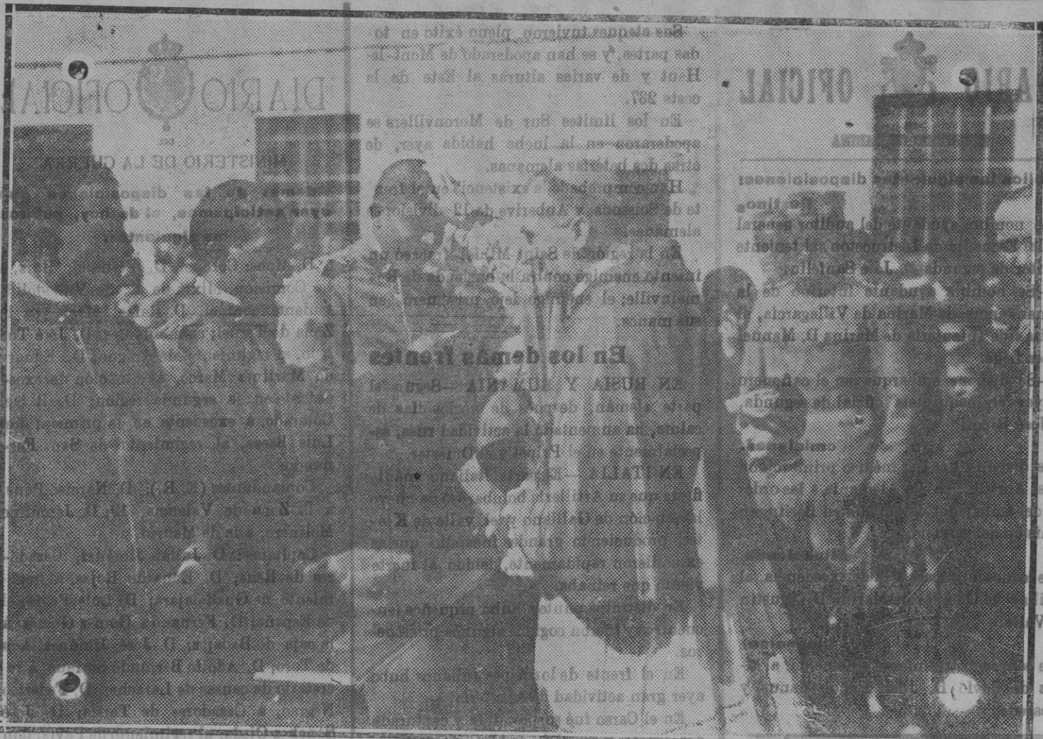
Un prelado italiano bendiciendo á los soldados que van á partir para la guerra

Escuela Industrial, San Mateo, 5, de diez á trece y de dieciséis y media á veinte y media.