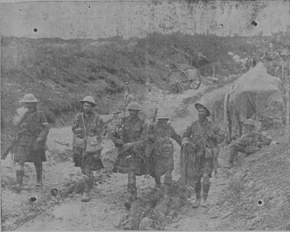
Un grupo de Highlanders volviendo de las trincheras del frente belga.

del Gobierno y los proyectos del ministro, y asegura que el decreto que puso fin á la huelga ferroviaria contradice el proyecto de protección á la industria, así como la reciente disposición sobre alumbrado es enemiga de la protección al aprovechamiento de saltos de agua.