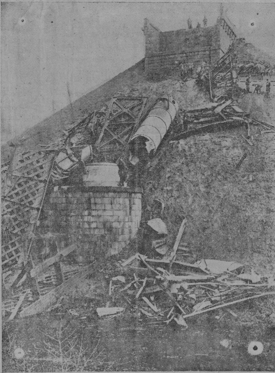
El viaducto del ferrocarril en el trayecto de Vilna Danaburgo, volado por los rusos y reconstruido en ocho días por los alemanes.

Tres años después fué destinado al regimiento de Africa, de guarnición en Me-