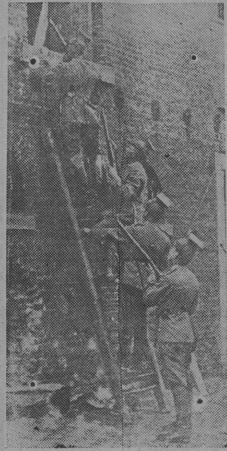
Grupo de ulanos registrando una cava abandonada por el enemigo.

Austria se ha visto obligada á abandonar en el Friul oriental una extensa faja de territorio, y se ha limitado á ocupar la línea preparada de antiguo en el Isonzo, poniendo así entre su Ejército y el italiano un río de corriente rápida, no vadeable y sujeto á frecuentes inundaciones.