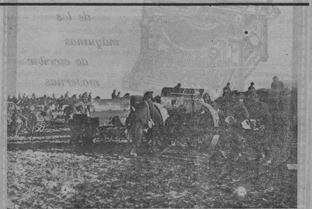
La influencia alemana en la organización del Ejército turco.—Desenganchando el avanztrén de una batería en el desierto.