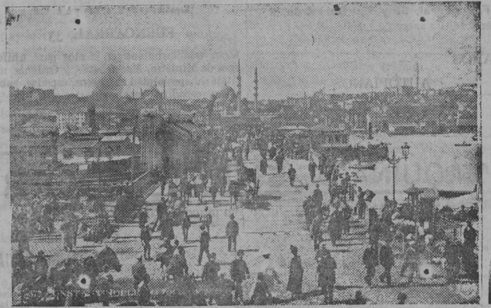
El puente de Galata en Constantinopla.