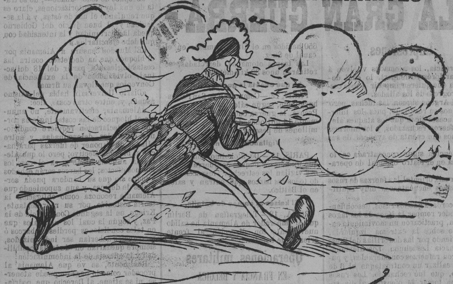
Treinta y siete mil firmas! ¡Cien mil tarjetas!