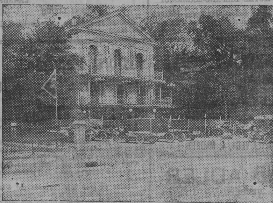
El teatro Real del parque de Laeken, Bruselas, convertido en hospital de heridos de la guerra.