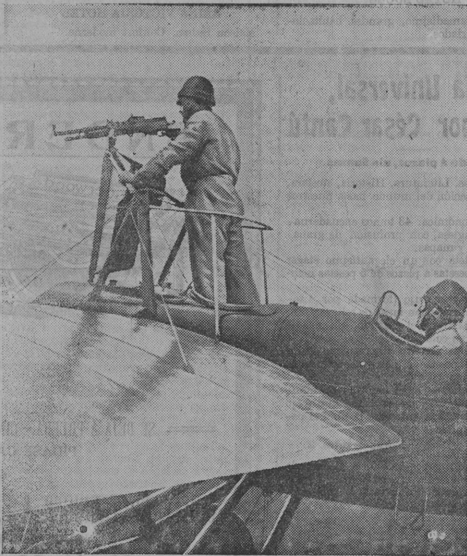
Un monoplano francés armado y blindado con destino á la cacería de aeroplanos enemigos.

Por esto y por el legítimo triunfo que ha obtenido, felicitamos al señor ministro de Marina y felicitamos también á todo el personal de la Armada.