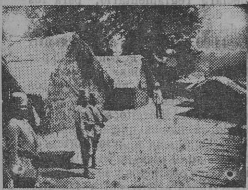
Los akaris al servicio de Alemania haciendo guardia en Boea.

Escorbaban al buque almitante los torpederos «numeros 2, 4 y 5».—C.