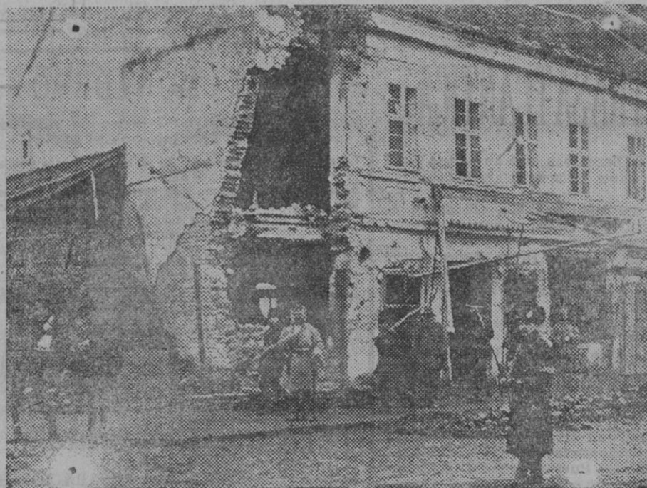
LOS ESTRAGOS DE LA GUERRA.—Una casa de Belgrado destruida por los obuses enemigos.

Art. 2.º Los sueldos de los jefes y oficiales a que se refiere la presente ley