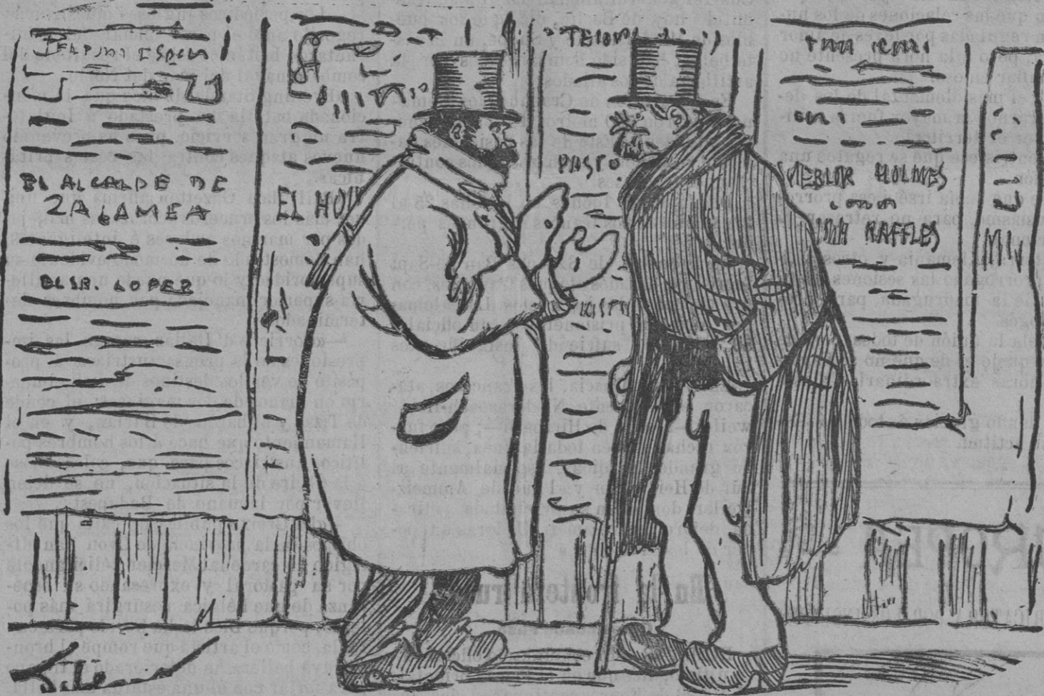
—Hasta ahora el mayor éxito de la temporada ha sido el de León, Alcalá Zamora y Salamanca.