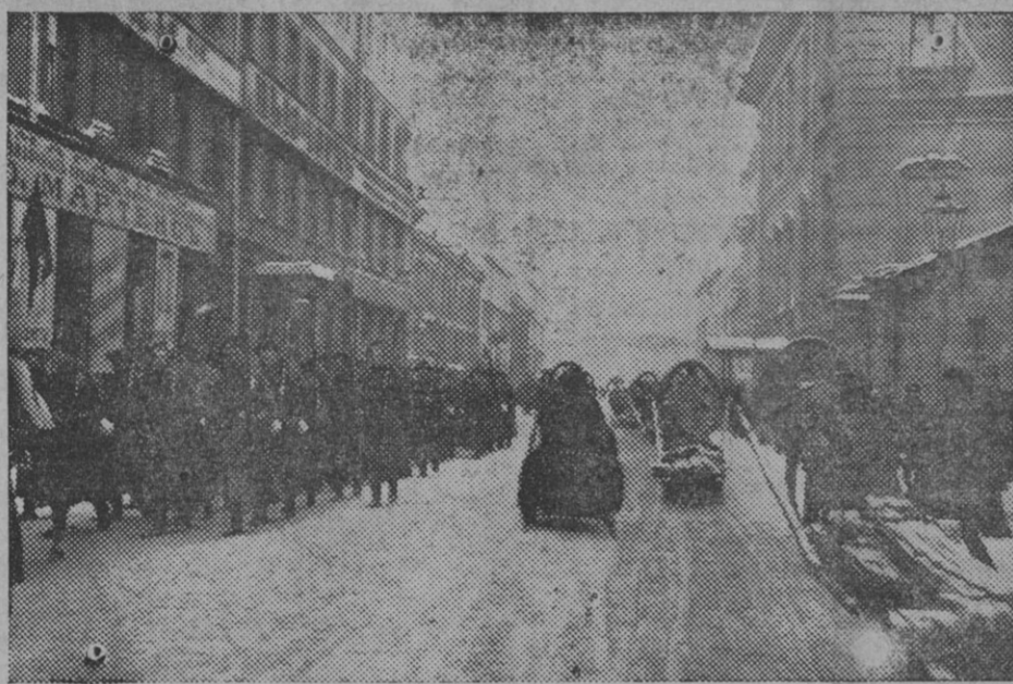
Infantería rusa en marcha hacia las líneas de combate.

La noticia no es exacta: Su Majestad sufrió, en efecto, una indisposición pasa-