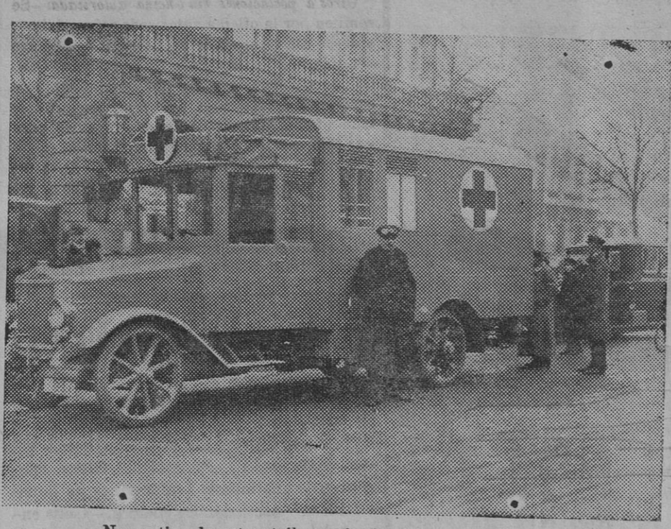
Nuevo tipo de automóviles sanitarios del ejército alemán.

«Il Giornale d'Italia» publica una estadística aproximada de las víctimas causadas por los terremotos. En Arezza-