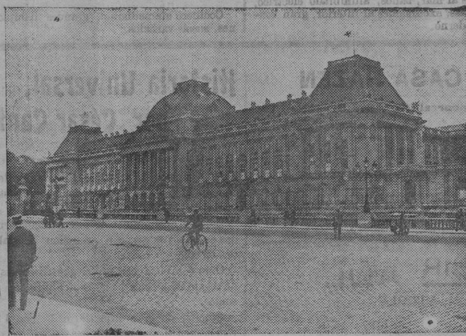
El palacio Real de Bruselas, que acaba de ser convertido en hospital.

Lleva 150 soldados de distintas Armas, varios jefes y oficiales, víveres y municiones.