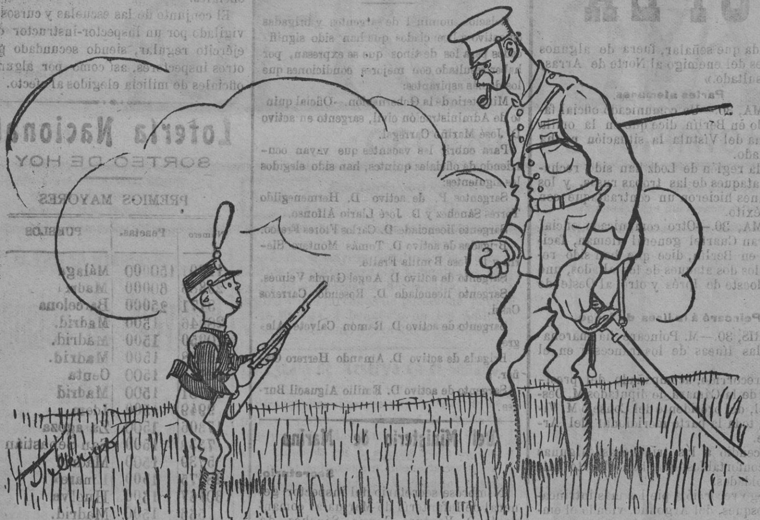
¡Oído á la voz de mando! ¡De frente! ¡March!