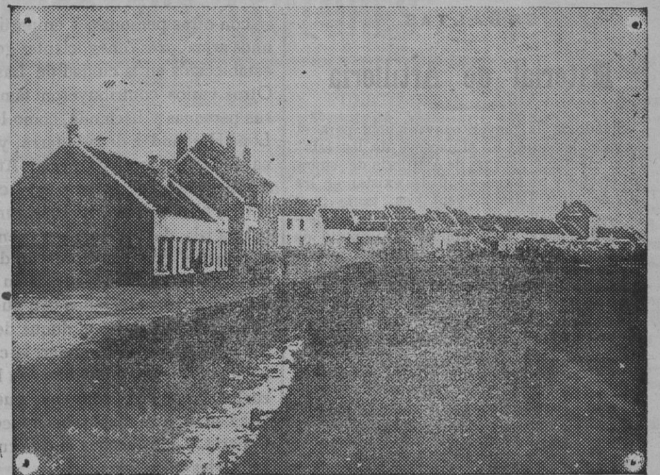
La villa de Mariakerke, desde donde los alemanes han bombardeado la flota inglesa.

Todo da a entender que se prepara algún acontecimiento.