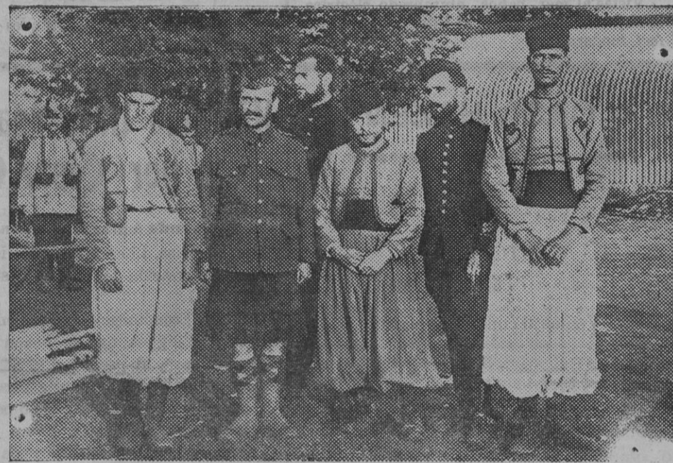
Un grupo de prisioneros franceses é ingleses en Alemania.