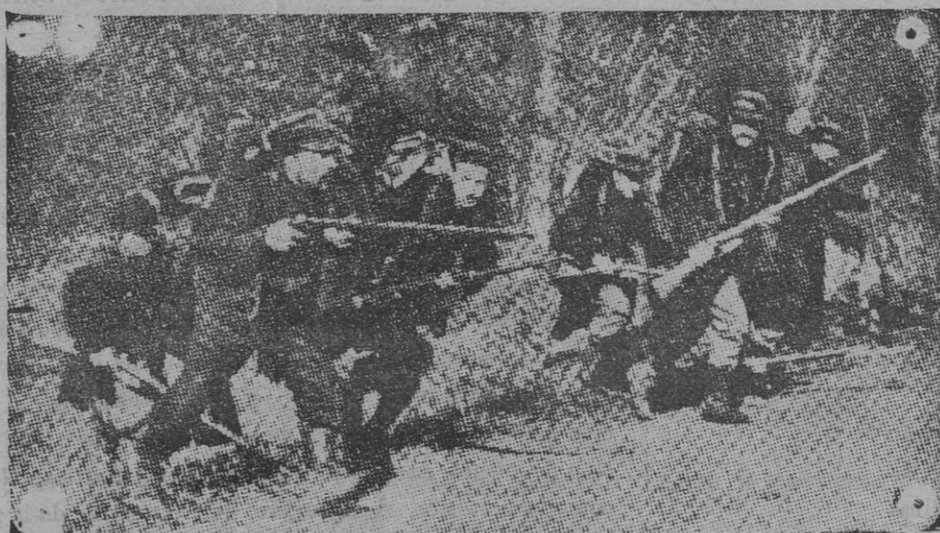
Infantería belga saliendo de una trinchera para atacar á los alemanes en las proximidades de Dixmude.

El Estado Mayor alemán comunica el siguiente parte, con fecha 7 de Noviembre: «Nuestros ataques en la dirección de Iprés han progresado también ayer, sobre todo al Sudoeste de esta población, donde hemos hecho 1.000 prisioneros franceses. Los ataques franceses al Oeste de Nonoy, así como á las poblaciones de Vailly y Chavonne, recientemente tomadas por nosotros, han sido rechazados, con graves pérdidas para el enemigo. El pueblo de Soupir y la parte Oeste