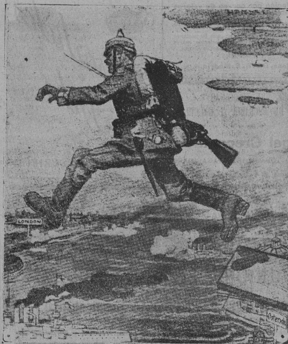
Las esp. ranzas alemanas saltando desde Ostende á Inglaterra, según un dibujo del «Lustige Blätter».