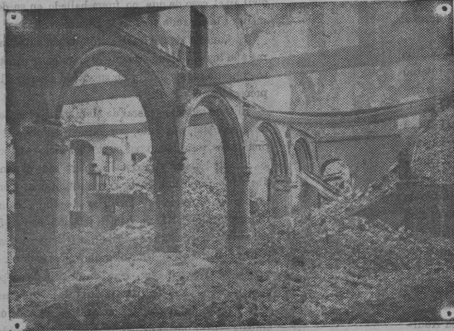
El vestíbulo de la biblioteca de Lovaina destruida por los obuses alemanes.

En la época de la dominación árabe y siempre que esta raza entraba en combate, señaladamente en los trances apurados, elevaban los combatientes plegarias breves, exentas de ceremonias interminables, pidiendo á Mahoma el triunfo.