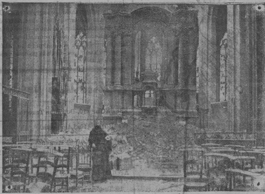
El interior de la Catedral de Lovaina.