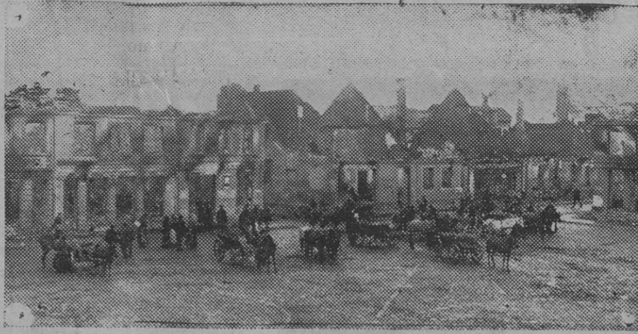
Posición aproximada de los frentes de alemanes y aliados el día 20 del actual.

En la tarde del 24, los rusos, en el Norte de Rava, libraron combates encarnizados a la bayoneta, infligiendo a los alemanes pérdidas considerables.