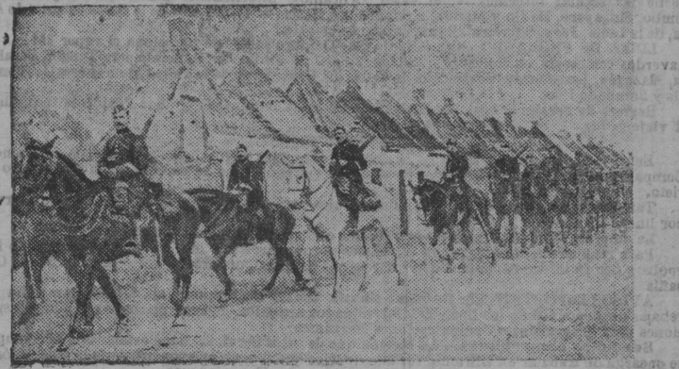
Caballería belga al regresar de la línea de fuego.

En el Sur, los partidarios del pretendiente prosiguen en su actitud; pero sin resultado alguno.—C.