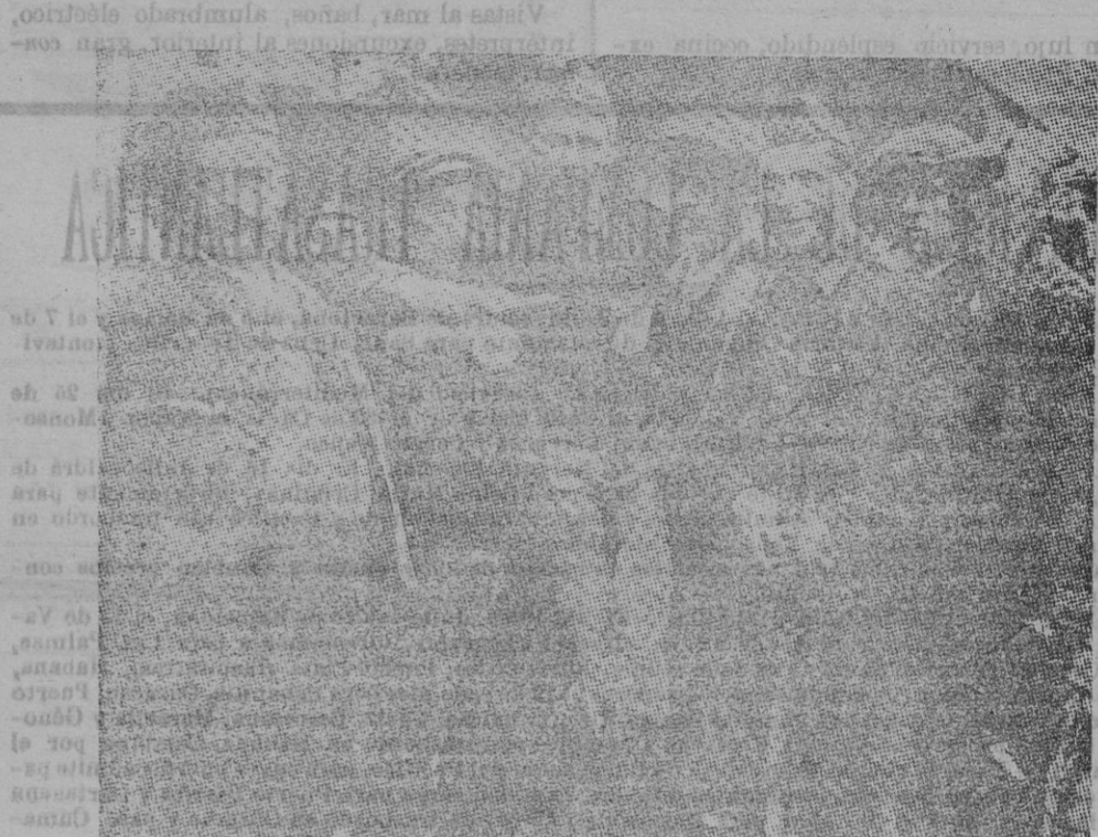
Episodios de la guerra.—Conducción de un soldado inglés, herido.

La columna alemana quedó completamente aniquilada, dejando sobre el campo, convertido en inmenso lago, cañones, material, salvándose muy pocos de la hecatombe; heridos unos por la metralla y ahogados la mayor parte.