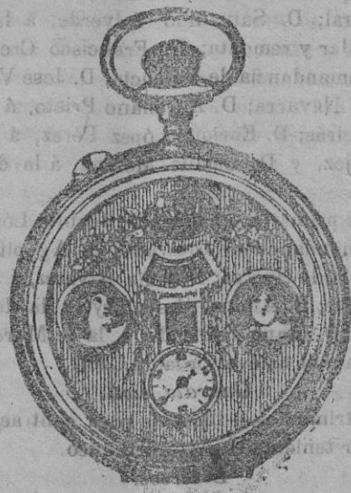
El maravilloso reloj automático

Madrid.-FARMACIA, 6, principales.-Apartado de Correos, núm. 329