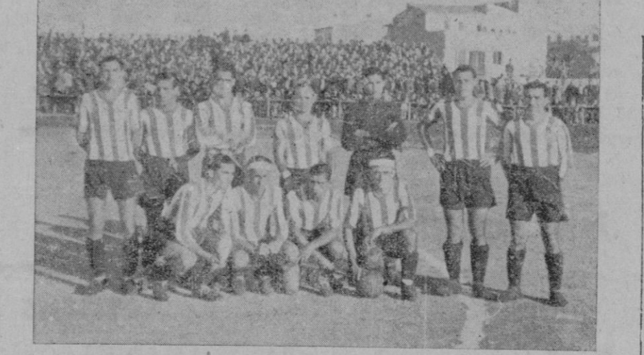
El equipo del Atlético F. B. C. que coronó ayer su brillante actuación de esta temporada obteniendo para su Club el título de Campeón