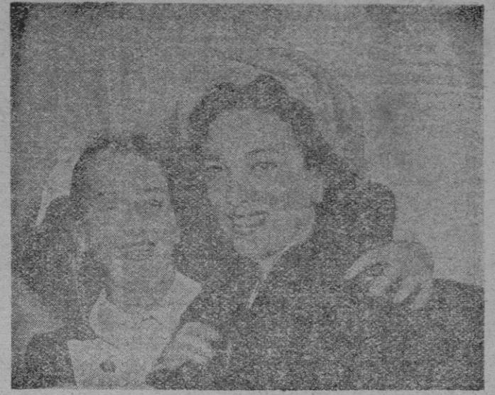
La actriz Linda Darnell abandona la clínica londinense donde ha sufrido cinco semanas con ictericia. Traten de imaginar su rostro antes del sufrimiento.

Se añade que la armada norteamericana, contará en junio de 1952 con 1.200 navios y 800.000 hombres, mientras que la aviación elevará sus efectivos a 95 escuadrillas, cuyo coste se elevará a dos billones de dólares.—Efe.