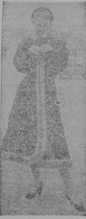
Esta simpática maniqui posa para "BALEARES" en la plaza de la Concordia, a la salida del Salón, con un modelo de astracán y visón azul de Mendel-Maggy Roué y un sombrero de astracán negro de Marie-Christiane.

Pero señalemos en seguida que varios desfiles de modelos; los peluqueros crean peinados ante los asistentes; los "stands" de belleza —con sus innumerables "números" nuevos— rodean el Salón. Este año Douking ha sido el encargado de decorar el Salón —que se instaló en los Campos Eliseos— y la Exposición tenía un lema: el sol.