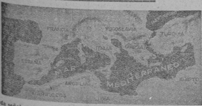
Señalada en blanco, en el gráfico, la zona que se ganaría al mar al descender el nivel de éste unos 200 metros

UN GRUPO DE INGENIEROS EUROPEOS HA REALIZADO UN PROYECTO FANTASTICO Y AUDAZ. SI LA OBRA SE LLEVASE A EFECTO SERIA, SIN DUDA, LA MAS COLOSAL REALIZADA POR LA MANO DEL HOMBRE EN EL TRANCURSO DE LOS SIGLOS.