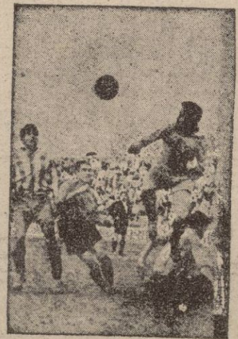
MARTIN despeja otra situación de peligro para su meta. Estaban a punto para el remate Sans y Morro

Ejemplos a montones los hemos tenidos en otros equipos. Cuando fijaron su vista en piezas de otras regiones y nutrieron su equipo con exceso de aquellos elementos bajaron en la tabla de clasificación de manera muy notoria. Cuando quisieron valerse con una mayoría propia triunfaron.