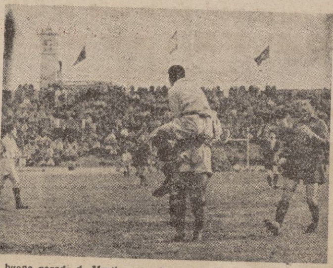
Una buena parada de Martín a un disparo de Agustí.

Saben los jugadores mallorquinistas conistar en la forma en que les llaman. ¿Qué se juega fuerte? Pues allí están ellos para resistir fuerte también. ¿Qué se juega al fútbol como en el caso del Málaga y del Granada? Pues ellos a jugar al fútbol — menos tal vez — pero más efectivos y sin estridencias. ¿Nombres? Ninguno. ¿Figuras? Ninguna. ¿Hombres? ¡¡, con un corazón así de grande que no les cae en el pecho y que es capaz de superar los más grandes escollos.