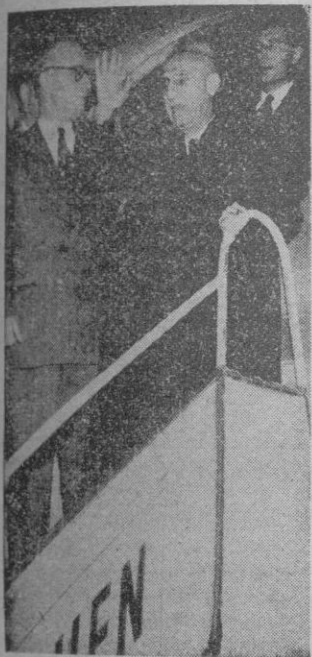
Mussadig a su llegada a Washington

N ORTEAMERICA NO TIENE DE LA PALABRA "HOSPITAL" ese concepto triste y lastimoso que a nosotros nos embarga. Para disimularlo, solemos llamarlos sanatorios. Allí se llaman simplemente hospitales. Entre los numerosos de Washington hay dos que nadie podría identificar por su aspecto exterior. Uno es el Walter Reed, y el otro, el Bethesda. El primero está enclavado en los altos aristocráticos de la calle 16. Sus jardines, sus piscinas, sus campos de golf y tenis y sus majestuosos edificios, le dan apariencia de todo, menos de un hospital. Sin embargo, es el hospital militar. El otro, fuera de la línea del distrito, ha podido romper las ordenanzas contra los rascacielos en Washington levantando una torre de 16 pisos en las praderas onduladas de Bethesda. Es el hospital naval. Ambos construidos con largueza y asistidos con un presupuesto generoso, son en la práctica pequeñas ciudades estanco, donde pueden repararse al igual enfermedades del cuerpo que del espíritu. Quienes tienen acceso a ellos por derecho propio, los utilizan muy a menudo como hoteles de reposo y recreo. No es extraño, pues, que, ocupando una "suite" presidencial del hospital militar Walter Reed, el primer ministro iraní, Mohamed Mussadig, se sienta un hombre nuevo de cuerpo y espíritu, con su nacionalización del petróleo y sin vahidos. Desde el anuncio de presentar personal-