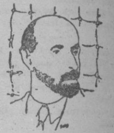
J. R. JIMENEZ

—Con una estimativa de tipo "oficial". Creo que un poeta es perfecto, cuando recibe esa consagración universal que significa el Premio Nobel. Si se pudiera obtener ese supremo galardón para nuestro Juan Ramón Jiménez, agregaríamos a sus méritos insuperables, la resonancia mundial que tal Premio representa. No obstante, a pesar que Juan Ramón todavía no ha sido "consagrado" por Estocolmo, representa para mí el tipo de "poeta perfecto".