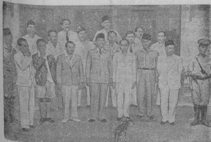
El Presidente de Indonesia Doctor Sokarno rodeado del Gobierno en su residencia de Batavia, poco después de haber celebrado la primera reunión oficial, posa para los fotógrafos del Ejército británico en Java. Sokarno es el del centro, con uniforme y fez, y su Primer Ministro que viste de blanco se halla a la derecha.

«España ha sido respetada, y lo ha sido por su peso específico y por su propio valor, porque había tenido una Cruzada que demostró que el temple de sus hombres y sus juventudes era el mismo de los mejores tiempos; si no se traspasaron nuestras fronteras y se hollaron nuestros territorios, es porque había aquí veintisiete millones de españoles dispuestos a hacerse respetar y esto pasó ayer, pasará mañana y sucederá siempre.»