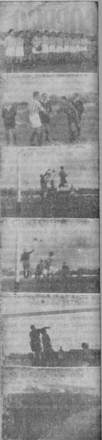
Equipo de la Real Sociedad Pati y Pocovi, capitanes de equipo se saludan