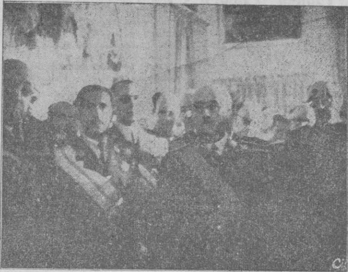
Madrid. — S. E. el Jefe del Estado recibe a los Ministros y altos Jefes militares, en el Palacio de El Pardo, con motivo de la Pascua Militar.