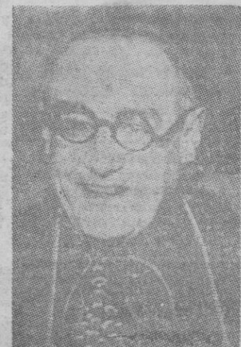
DR. PLÁ Y DENIEL

Washington.—El Departamento de Agricultura ha autorizado a siete países europeos para comprar 14.500.000 bushels de trigo en Estados Unidos durante Febrero. Las autorizaciones suponen un aumento de 3.750.000 sobre la cifra aprobada para Enero. Según las últimas cifras el cupo concedido a Francia incluyendo África Septentrional, zona francesa de ocupación de Alemania ha recibido la autorización para adquirir 300.000 toneladas. Holanda 23.000. Noruega 8.000. España 8.000. Portugal 12 mil y Suiza 8.000.—Efe.