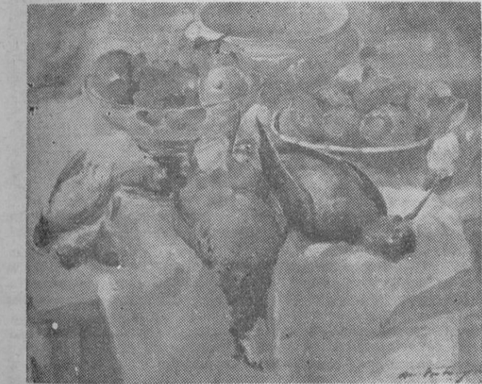
M. VERBURGH. — Bodegón.

La posición estética de este pintor se halla igualmente alejada del realismo estricto que del impresionismo elemental, para expresarse en un lenguaje espontáneo, en el que se definen de modo original, dentro de los cánones modernos, ideas, sentimientos e impulsos, cuanto constituye su espiritual estado de ánimo.