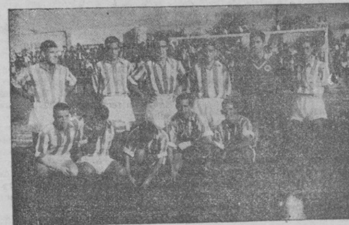
El equipo de la Real Sociedad, que nos visitó el pasado año y que fué vencido por el Mallorca en el Campo de Buenos Aires

Por otra parte, quisiéramos saber cual será el que se niegue