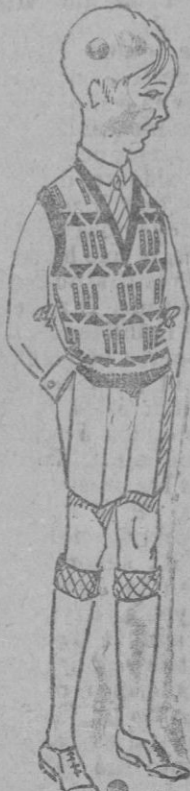
PULL-OVER PARA NIÑO.—Lana tricot banda moderna, fondo almendra, dibujo marrón y verde almendra

Casa fundada en 1852 Matrículas: Preciosos, I Libros: Preciosos, 6 Correspondencia: Apartado 12.250, Madrid