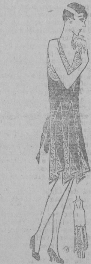
VESTIDO.—Vestido de crepon de china azul lavable y encaje plata. Paños levantados.