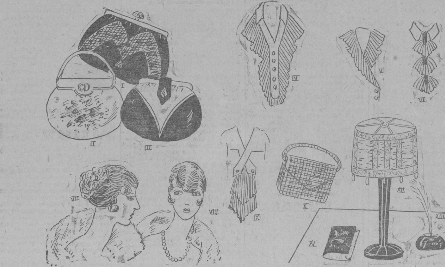
PANORAMA «COLIFICHETS».—1 Bolsa de mano de piel de serpiente y de «chevron».—2 Este está bordado punto «passé».—3 Vosotras podéis hacer este bolso de piel de dos tonos, camafé beige y marrón, dos azules, etc., montado sobre cierre que hace juego de tono.—4 Un cuello y jabot de china blanco.—5 Otro jabot.—6 Jabot y encaje, atravesados de un terciopelo.—7-8 Dos coifuras nuevas con muchos bucles.—9 Un jabot muy original.—10 Un bolso de cuero fantasía.—11 Cubierta de libro en terciopelo bordado «passé».—12 Una pantalla de «sponge» amarilla y encaje del tono.—13 Un tintero decorado.

La novedad aconsejada hoy, particularmente por los médicos italianos, es que la madre, antes de amamentar al recién nacido, haga el análisis de la leche. En Italia se está estudiando la posibilidad de imponer por la ley, este análisis. Como que de una mala calidad de la leche materna pueden deducirse consecuencias fatales para el niño. Por ejemplo, el linfatismo, la anemia, flaqueza extrema o grosura excesiva y esto es muy de señalar—la mala dentadura del infante, que le