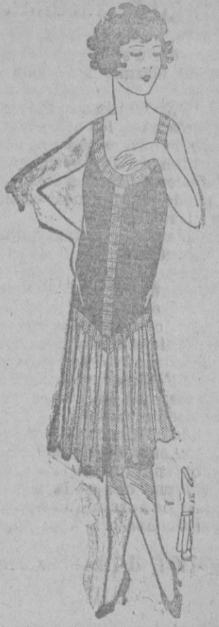
TRAJE PARA NOCHE.—Traje de geo lavanda, bordado de tubos de plata y de strass.