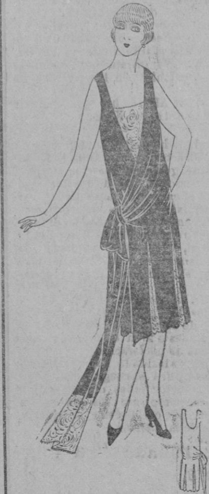
VESTIDO DE NOCHE.—Vestido en terciopelo frisson negro y encaje oro bordado rubí.