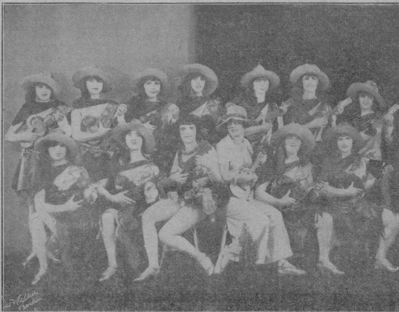
Algunas de las 18 bellas girls del «Espectáculo Ballet Riecko» que mañana miércoles debuta en el Lírico.