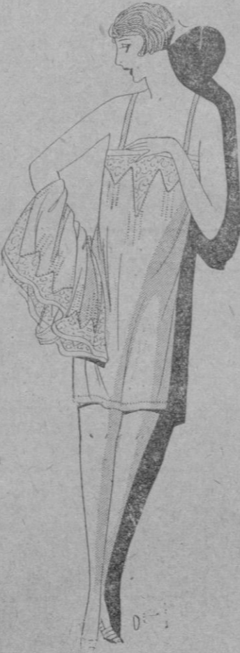
ACCEN.—He aquí un boni o adorno que comprende la corbata y el pantalón. Esos dos piezas son de crespón de china viejo rosa guarnecidos de encaje ocre que se incrusta en puntas ampliamente recortadas y que continúan por grupos de bailarinas.

Chassaigne Freres y Schumann Antigua Casa Banqué, Colón—34