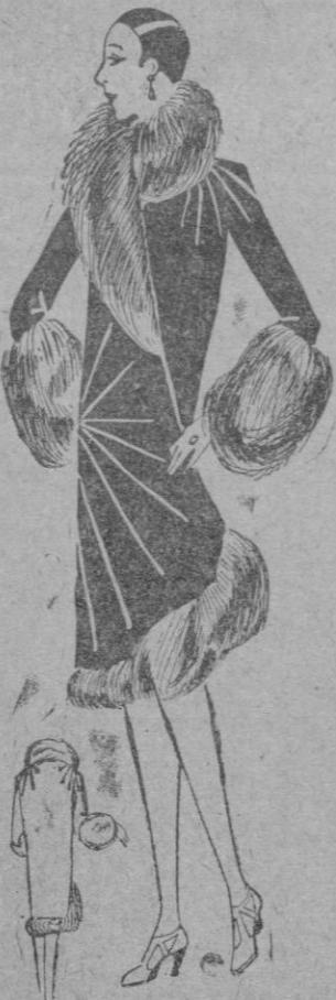
ABRIGO.—Abrigo seda negro guarnecido de renard; nervuras en radiación en los hombros bajo el brazado guarnecen la delantera.

El otoman será más empleado para el adorno de los vestidos de tarde y de numerosas toilettes de vestir que animarán la suavidad de las volutas fojas retenidas de sitio en sitio por un pequeño lazo plano tomado en el tejido del modelo.