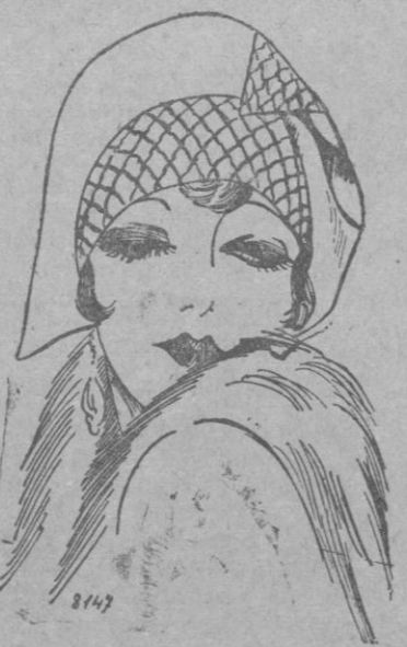
SOMBRERO.—Este, levantado, género arlequinista, ejecutado en fieltro fojo y marino sobre el cual se destaca la banca de crespón China rosa pálido adornado de puntas de seda negra.

Son sumamente prácticos los trajes sastre que enseñan bajo la chaqueta, la robe chemise , es decir la que lleva la falda montada sobre el cuerpo, formando una sola pieza con él. Este montaje muestra el lugar del talle, que es algo más alto que en temporadas anteriores. Continúan usándose mucho para «ir y venir» las faldas a pliegues, que resultan siempre tan bonitas y elegantes.