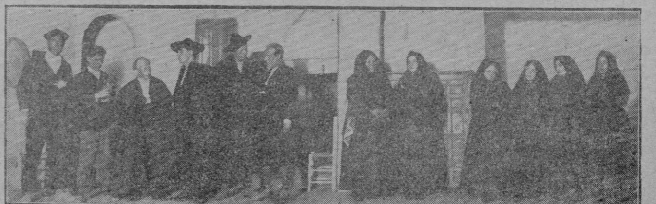
MADRID.—Una escena del drama « Los que no perdonan », de Eugenio Gorbea, que se ha estrenado en el teatro Esfava con gran éxito.