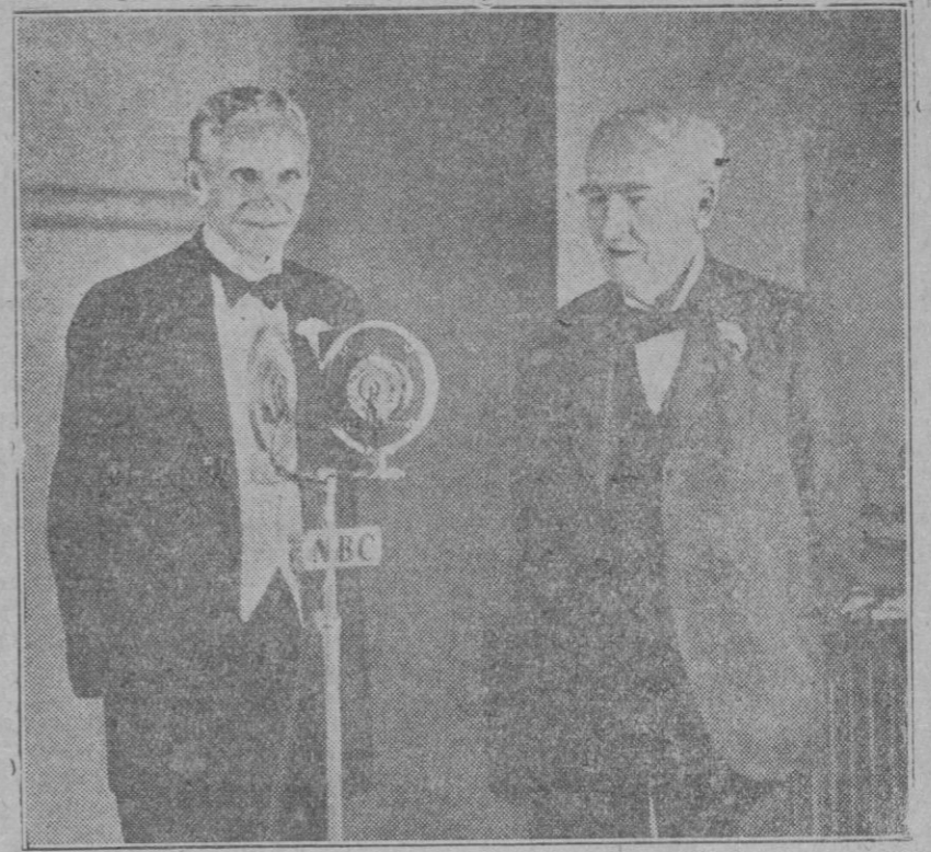
NUEVA YORK.—UNA INAUGURACION OFICIAL.—De izquierda a derecha, Thomas A. Edison el famoso sabio con el célebre millonario Henry Ford, que inauguraron la estación de Radio en el Madison Square Garden.