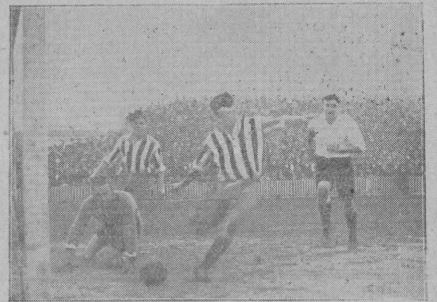
BILBAO.—Un momento de peligro para la puerta del « Arenas » de Bilbao, en el partido jugado el domingo contra el « Athletic », en el cual vencieron los primeros.