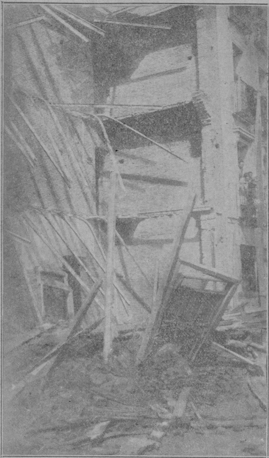
MADRID.—La casa en construcción de la calle de Topete cuya fachada se ha hundido sin que haya que lamentar desgracias personales.