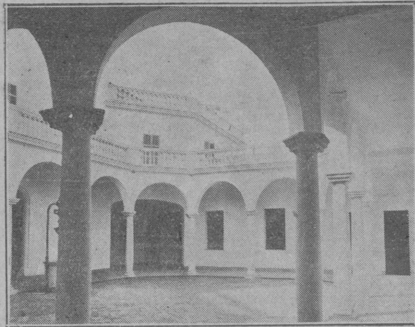
Fa fo de la nueva Escuela Graduada de La Puebla.