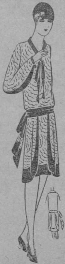
VESTIDO.—Vestido de crespón de china beige. Encaje mismo tono, realzado de ligero hilo de oro.