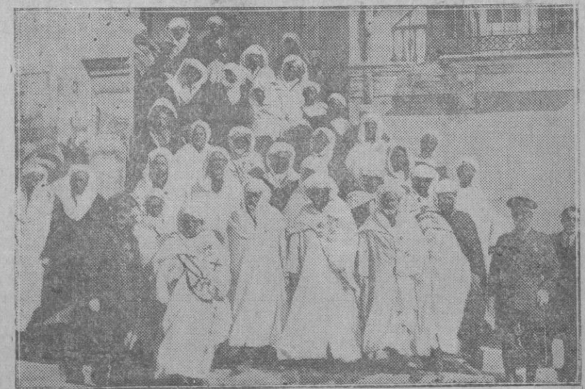
El Jefe de Tetuán, con los moros notables de la zona, que tan eficazmente cooperan a la obra de colonización que España, ha emprendido en Marruecos, después de conseguida su pacificación.