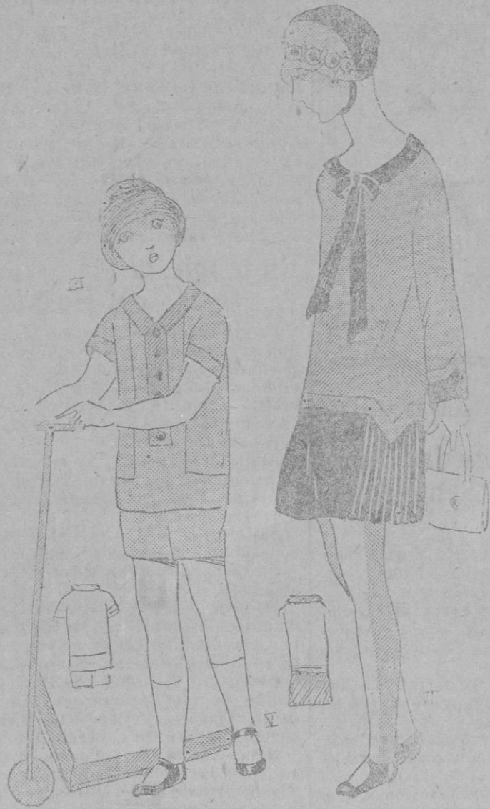
LOS NIÑOS: —Para los días frescos un vestido de kasha natural y kasha marrón.—Traje niño en lienzo ocre blusa con recortes.