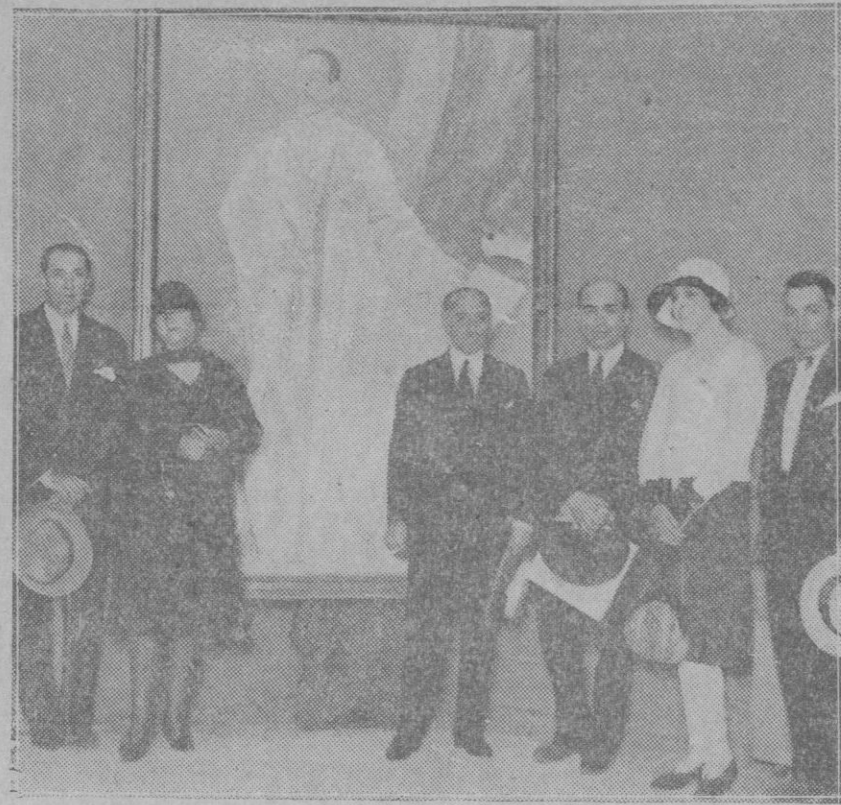
MADRID.—En los Salones de Amigos del Arte se ha celebrado una Exposición de Retratos del Rey, pintados por Vázquez Díaz.

Así nos permitimos interesarlo una vez más, apoyándonos para pretenderlo, aparte de las razones que inspiradas en la conveniencia pública hemos venido aduciendo para fundamentar nuestra pretensión, en las órdenes dictadas por el Excmo. Sr. Gobernador, con motivo de lo sucedido estos pasados días, órdenes terminantes encomendadas a conseguir que no se empleen fórmulas en la fabricación de alimentos que no hayan sido autorizadas, y que por las autoridades se cele para prevenir la adulteración de alimentos.