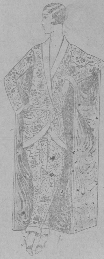
Pyjama para jovencita.

Los vestidos no perleados gozan a veces de aprecio. Se trabaja este año de tal manera la floja y delicada sedería, en coacs, en drapados majestuosos que «efflent» en tallo o la falda, que muchas elegantes prefieren la «façon a l'éclair» y los sabios drapados de perleados luminosos. Imaginad, pues, en satén maíz trabajado de esta manera: falda irregular, más larga por detrás, ampliamente fruncida, con un