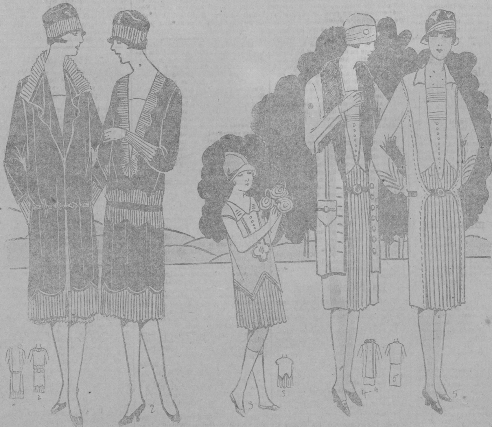
PANORAMA TOILETTES.—1 y 2 Abrigo y vestido de crepon satén marino, guarnecido de plisados de tafetán marino.—Tela abrigo: 4 metros de satén en 1 m.—Vestido: 3-70 en 1 m.—3 Vestido crepon de china szal pastel. Chaleco organdi blanco.—Tela: 250 en 1 m.—4 y 5 Vestido seda moaré con chaleco crepon georgette.—Tela: 3 m. en 1 m. 30.—Vestido: 1 metro 25.—Seda: 2 metros 50.