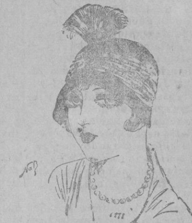
SOMBRERO.—Este elegante modelo de Lewis es de fieltro negro drapado de lamé plata y guarnecido de una crosse.

ancho cinturón drapado que termina por el lado un lazo. Este lazo, de una magnífica interpretación, cae en principio en anchos volantes, después reduce su volumen hasta el punto de no hacer más que un minúsculo coquillo que se fonde en el bajo de la falda y parece hacer cuerpo con ella.