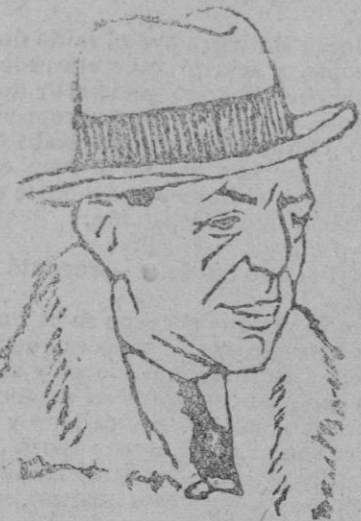
El extorero Ignacio Sánchez Mejías, autor de la obra «Sinrazón» recientemente estrenada en Madrid.

—He ahí los inconvenientes—dice Gedeón al enterarse del despilfarro—de hacer demasiado pronto a un hombre libre de sus acciones.