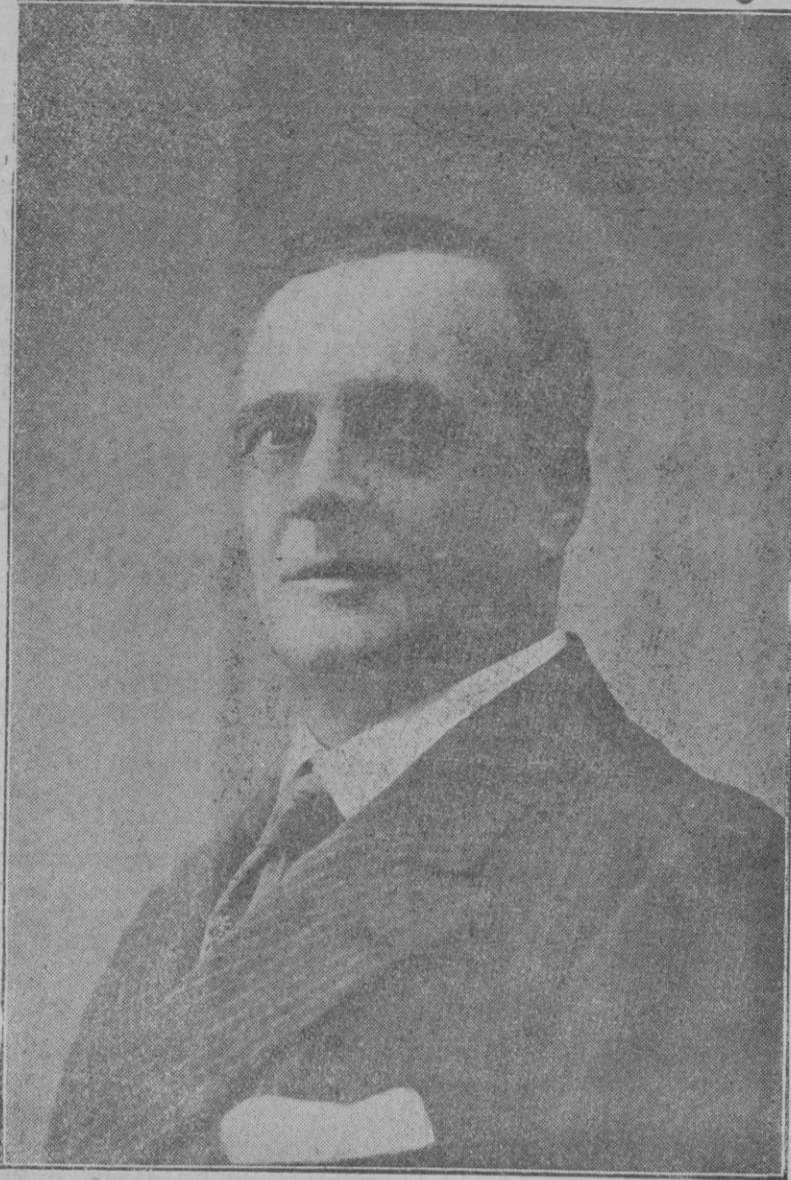
El eminente actor español Enrique Borrás, que el próximo sábado se presentará en el Teatro Lírico de esta capital, poniendo en escena «El Cardenal».

puede decirse que no tiene rival en el mundo.